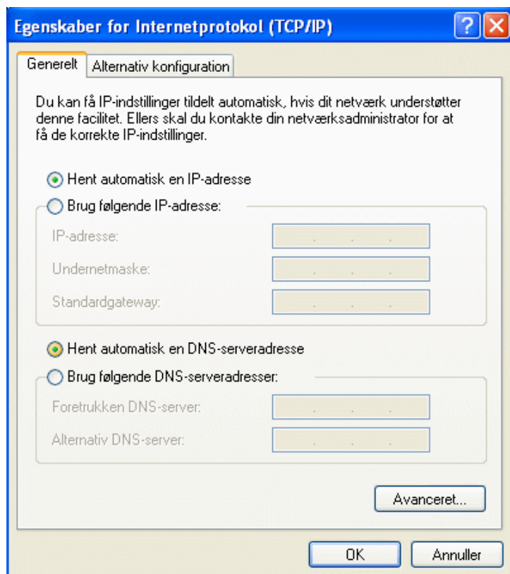
Figur 1 - TCP/IP egenskaber sat op som DHCP klient